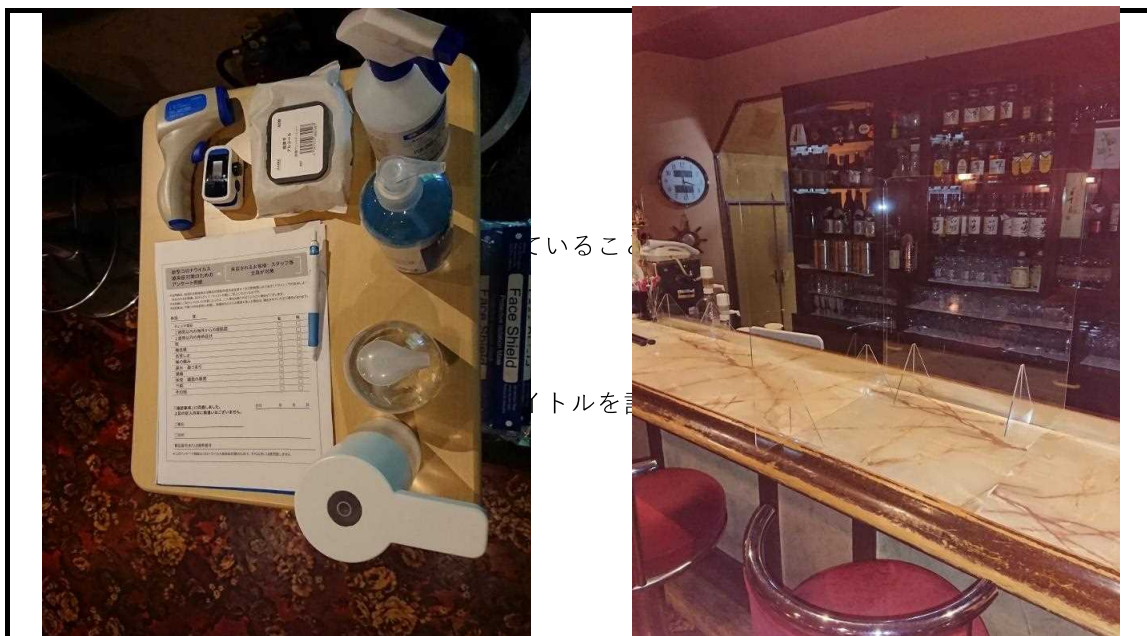
来店者リスト、検温等防止感染対策。