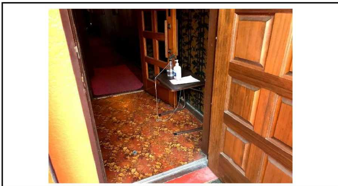
店舗入口を開けて換気を実施