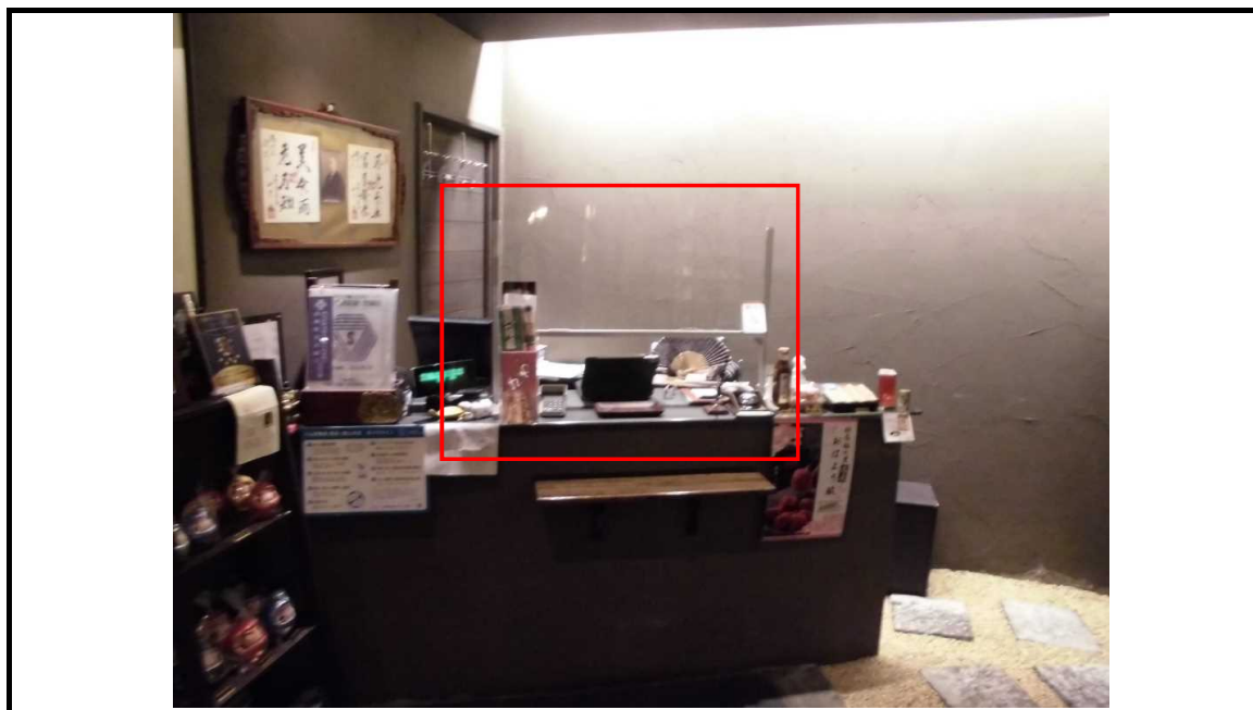
レジカウンターにおける従業員とお客様との仕切り