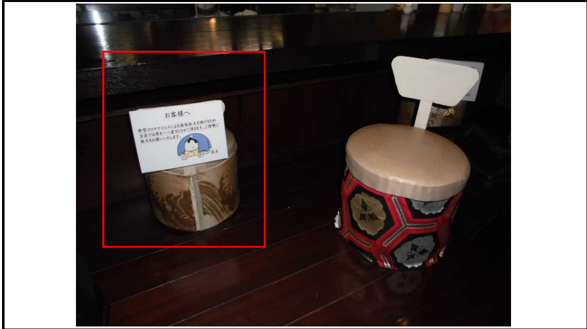
カウンター席の間引き