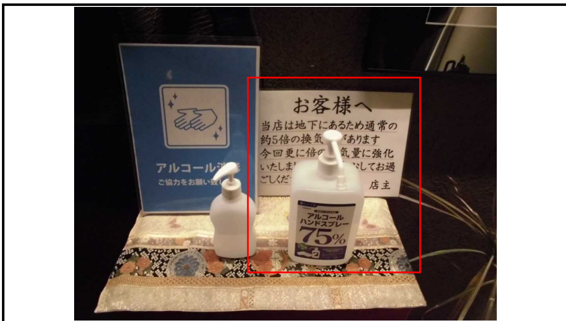
アルコール消毒液／換気量の案内