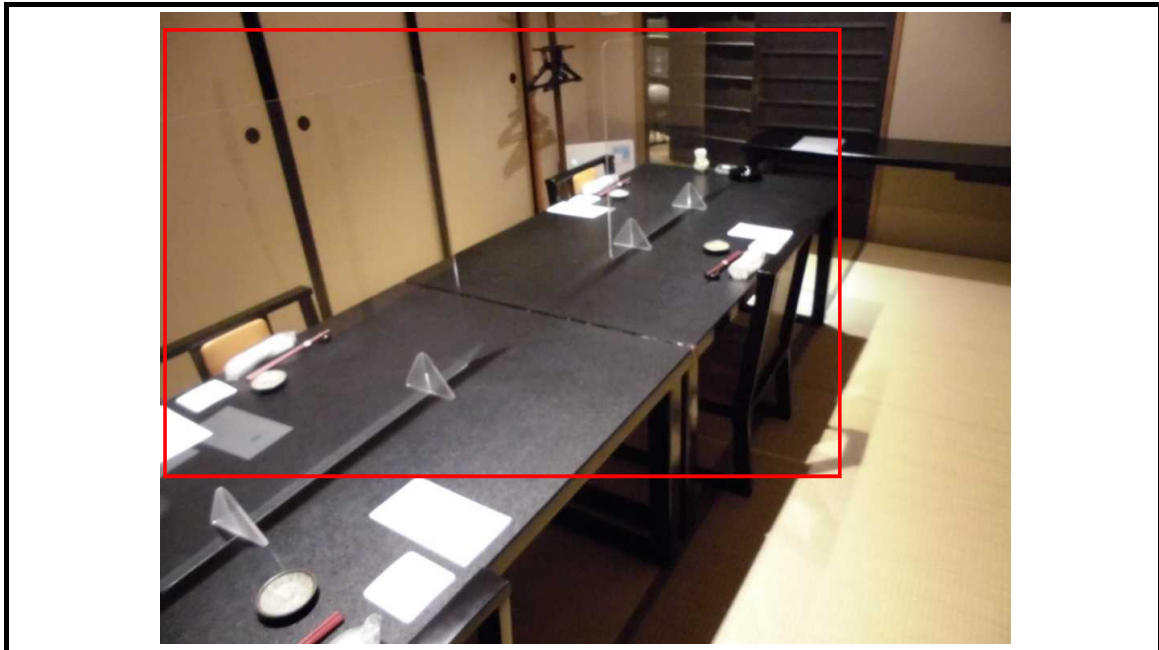
パーティションの設置／座席間隔の確保